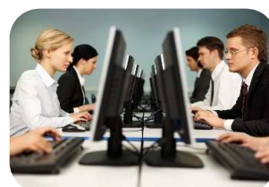
снижением продуктивности всех видов социальной деятельности

Человек проходит 3 стадии по развитию Интернет-зависимости.