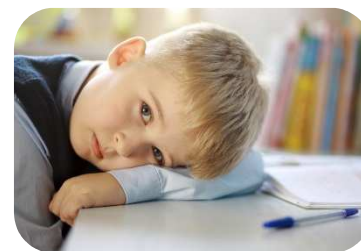
дефицит внимания и гиперреактивности

Для того, чтобы отталкивать, бороться с интернет-зависимостью, необходимо развивать в себе самоконтроль, участвовать и активно вовлекаться в различные социальные активности. При данной проблеме разрушается социальность человека. Наглядно это проявляется, когда люди отстраняются от своих близких. Возникает социальное обособление из-за неполного участия отдельных людей и групп в жизни общества, начинают доминировать неформальные социальные практики. Человек начинает изолироваться от социума, проявляет признаки явного избегания общества, происходит целая дезинтеграция социальных отношений и в целом «выпадение» из системы социального взаимодействия.