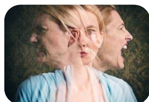
жестокости по отношению к окружающим;