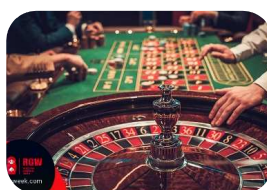
огромнейший список азартных услуги