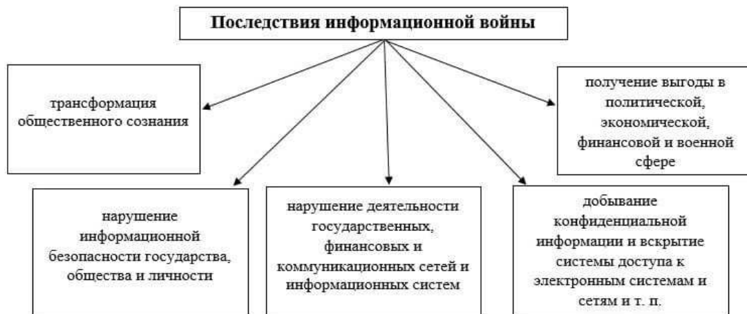
Рисунок 1.2 – Последствия информационных войн

Хочется отметить, что в настоящее время информационные войны стали уже неотъемлемой реальией. По своей сути информационная война уже стала разновидностью военного межгосударственного противостояния, которая представляет собой особую форму насилия, затрагивающую как противника, так и собственное население. При этом в информационной войне в качестве основного оружия поражения используется дезинформация.