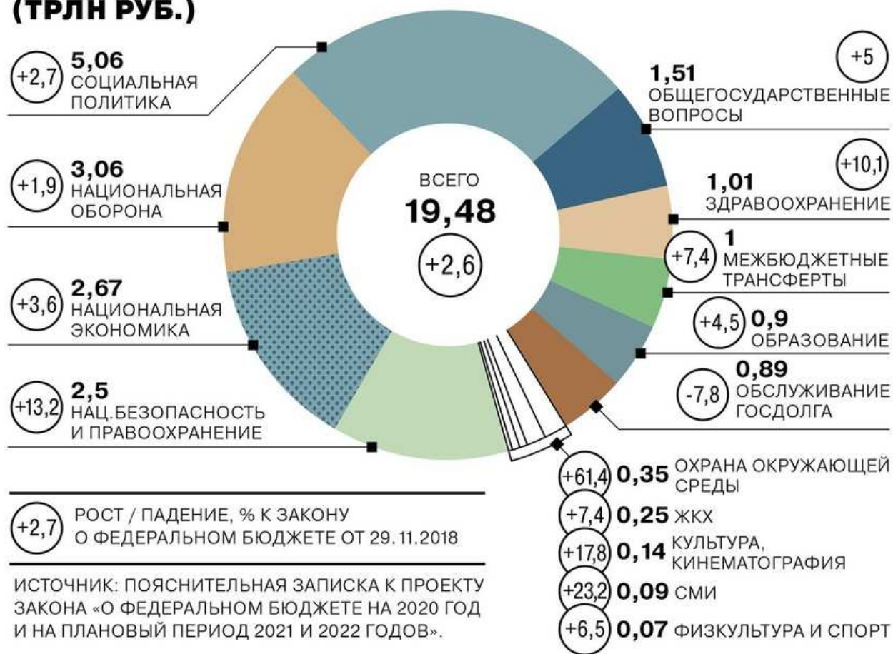
Рисунок 3 – Структура расходов бюджетов России за 2020 год

Таким образом, можно сделать вывод, что налоговая политика влияет на все социальные и экономические сферы, связана почти со всеми элементами управления в государстве. Государство стимулирует экономическое развитие, манипулируя при этом налоговой политикой. Но при этом главным направлением налоговой политики России является обеспечение экономического роста, увеличение показателей развития производства, его эффективности, возможности повышения уровня и качества жизни населения. Россия нуждается в развитой налоговой политике, при этом в эффективной, где налоговая политика будет заключаться в компромиссе между интересами как самого государства, так и с его налогоплательщиками.