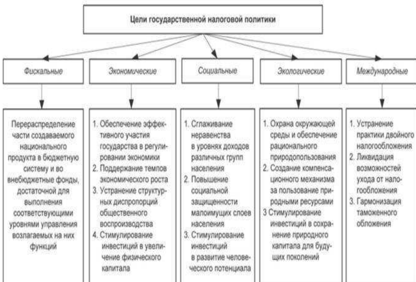
Рисунок 1 – Цели налоговой политики

Эффективность налогообложения определяется поступлением в бюджеты, вместе с затратами на сбор налогов и в отношении каждого определенного налога.