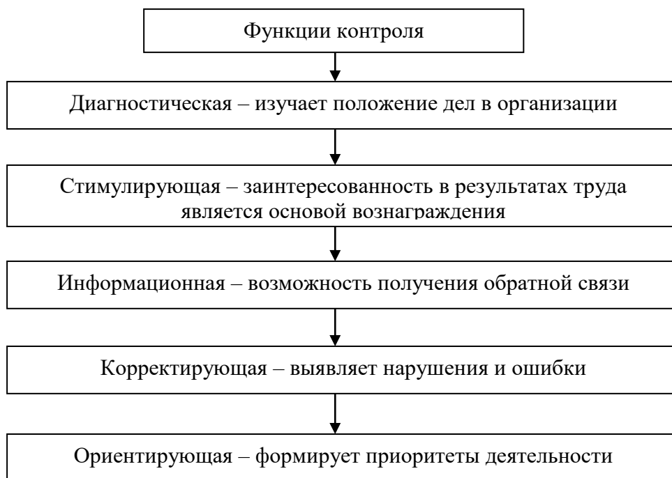
Рисунок 2 – Функции контроля

Контроль в компании является неотъемлемым элементом каждой стадии процесса управления. Для более четкого понимания сущности контроля и его взаимосвязи с экономической безопасностью, а также раскрытия контроля как системы и составной части системы управления организацией необходимо рассмотреть его функции, представленные на рисунке 2.