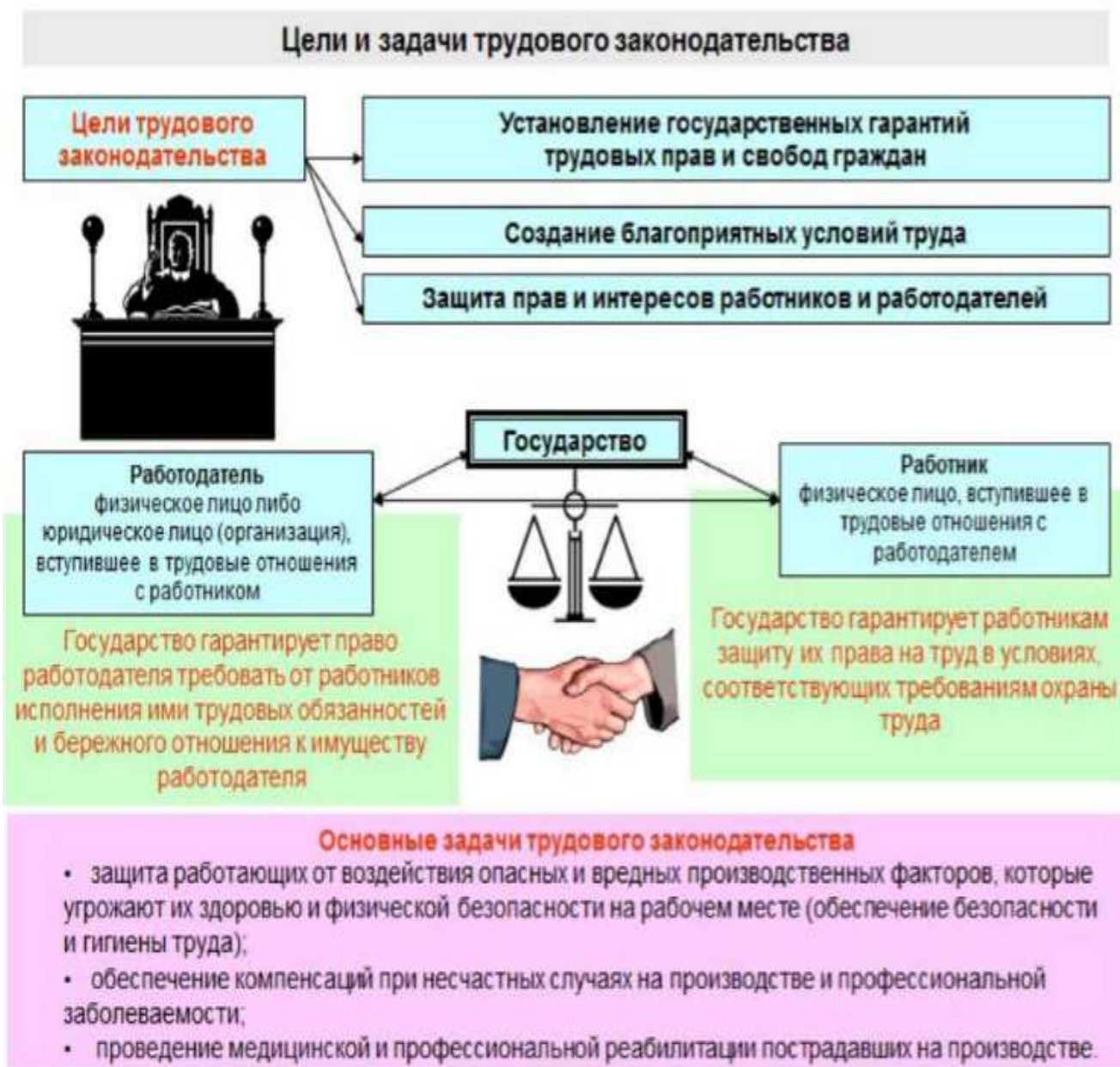
Рис.2 Цели и задачи трудового права в современной России

По данным рисунка 2 представлена информация о целях и задачах современного трудового права России. Можно увидеть, что трудовое право характеризует равные отношения как со стороны работодателя, так и со стороны рабочих, регламентирует отношения между людьми во время работы. При этом оно должно отвечать потребностям производства, защищать права работников и работодателей, способствовать развитию экономики государства. [3]