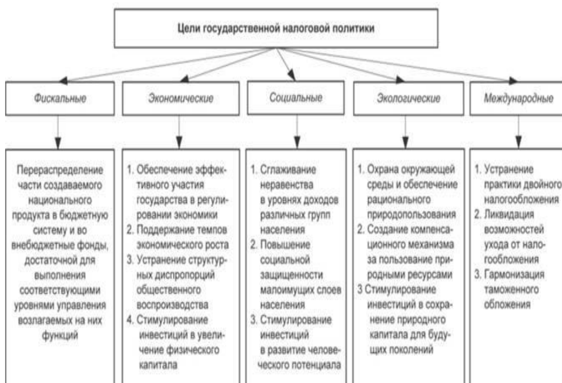
Рисунок 1 – Цели налоговой политики [4]

Как и в любом государстве, в Российской Федерации существуют определенные цели налоговой политики, которые представлены на рис.1: