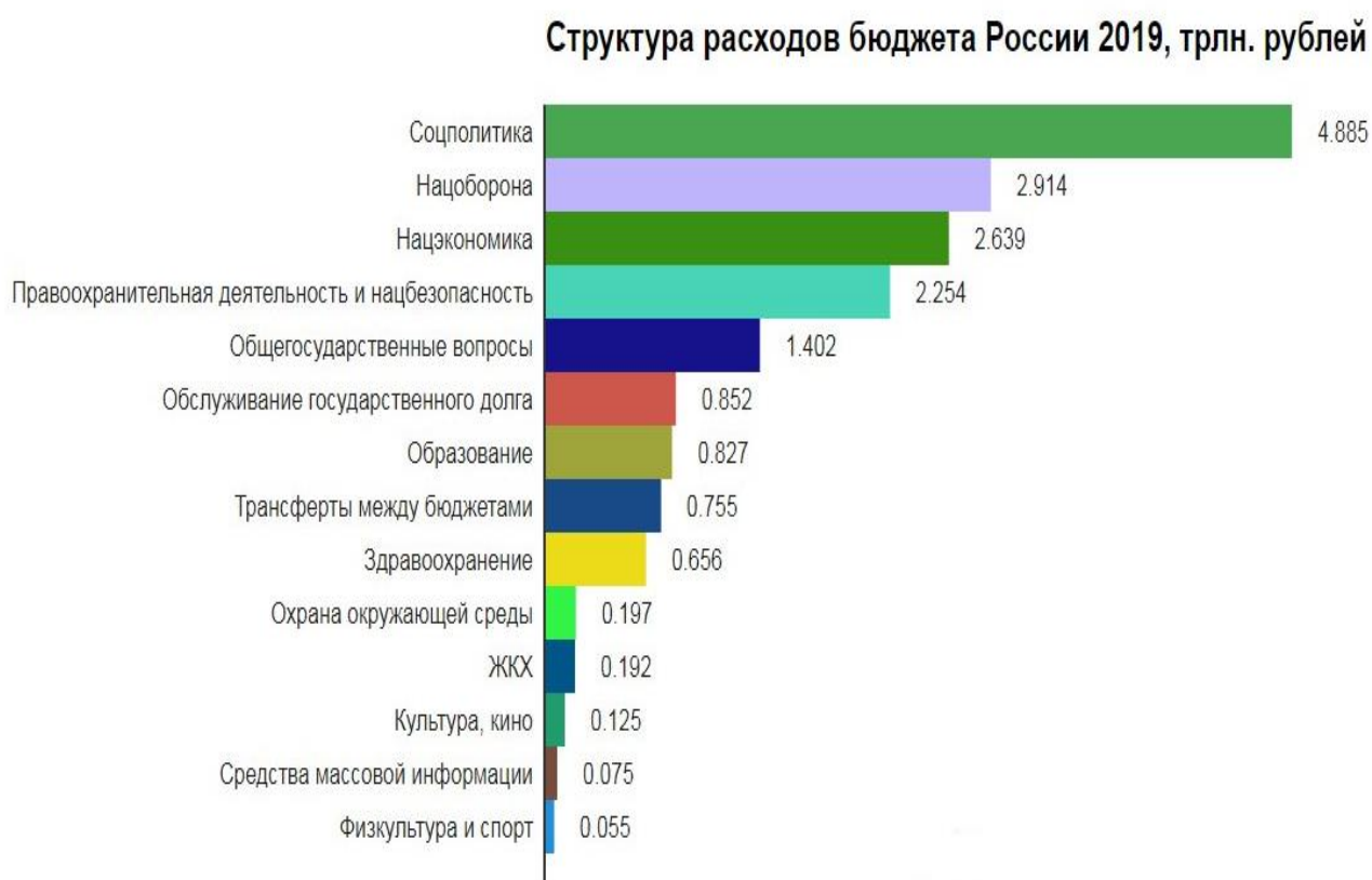
Рисунок 3 – Структура расходов бюджетов России за 2019 год

При этом данные о расходах бюджета Российской Федерации являются открытыми, и отражаются в виде статистических исследований (рис.3) [7]: