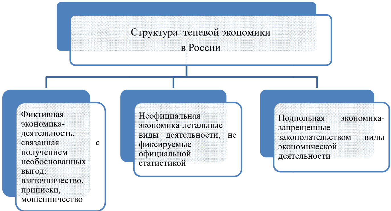
Рисунок 1. – Структура теневой экономики в России

В силу разумного толкования формально-правового подхода, теневая экономика является подсистемой криминальной экономики и имеет разновидность по трем критериям (рисунок 1)[3]: