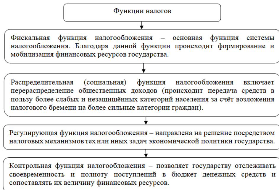
Рисунок 2 – Основные функции налогов

Основываясь на данных рисунка 2, можно сделать вывод, что на реализации налогами своих функций осуществляется базирование и основывается развитие всей налоговой политики совместно с денежно – кредитной и бюджетно – финансовой политикой, которая является одним из главных компонентов финансовой политики государства и экономической безопасности.