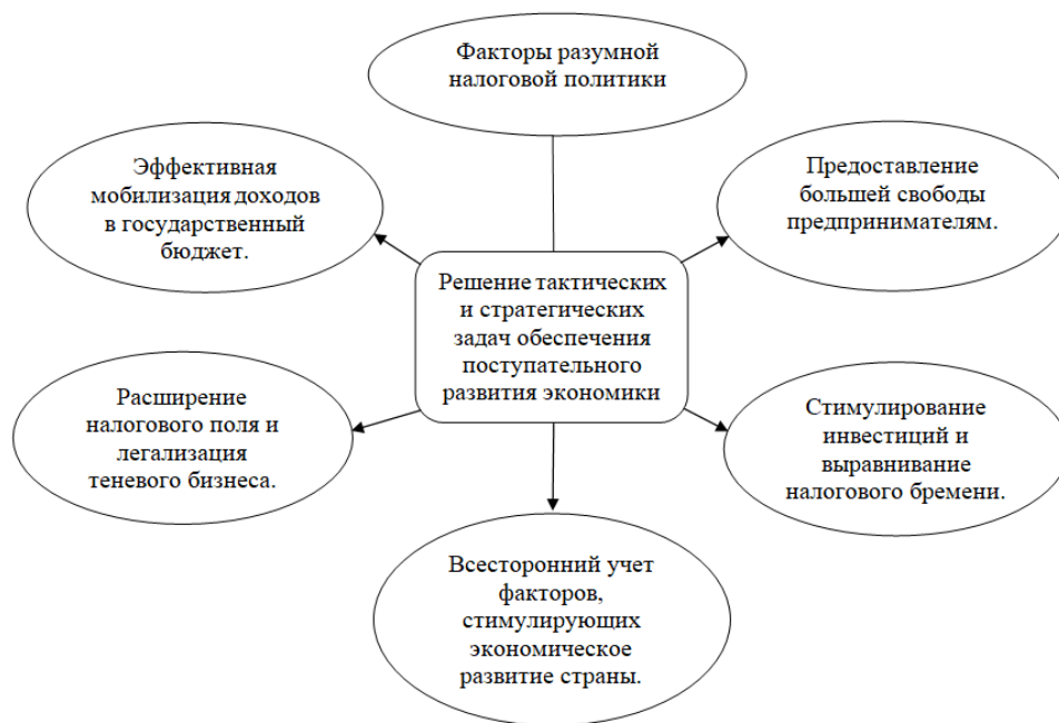
Рисунок 4 – Факторы разумной налоговой политики

Формирование разумной налоговой политики находится под влиянием множества факторов, отраженных на рисунке 4, между которыми существует тесное взаимодействие, обеспечивающее стабильность и развитие как налоговой системы, так и ее отдельных звеньев.