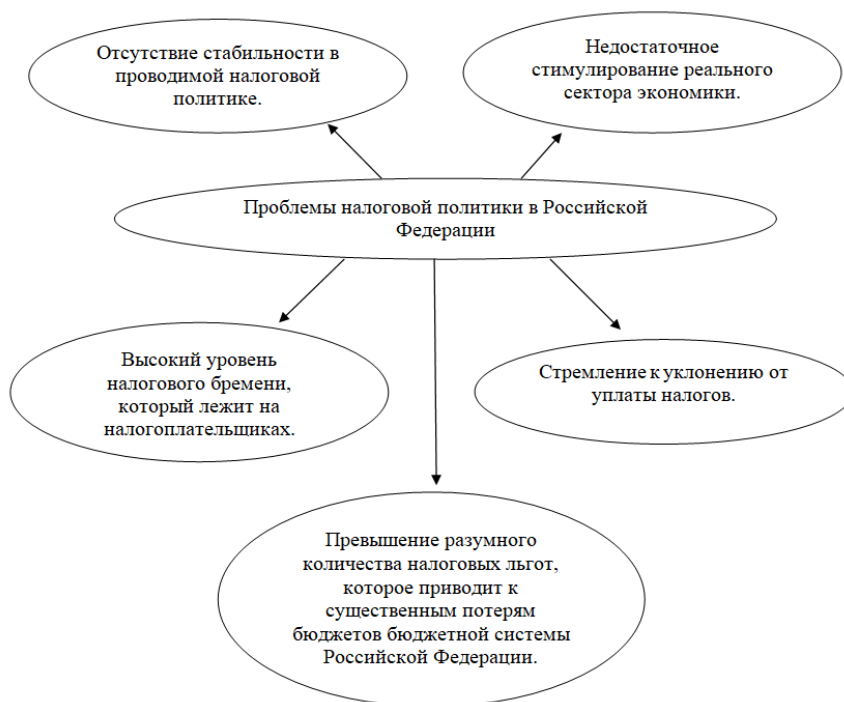
Рисунок 1 – Проблемы налоговой политики в Российской Федерации

Среди актуальных проблем налоговой политики можно выделить проблемы [4], представленные на рисунке 1.