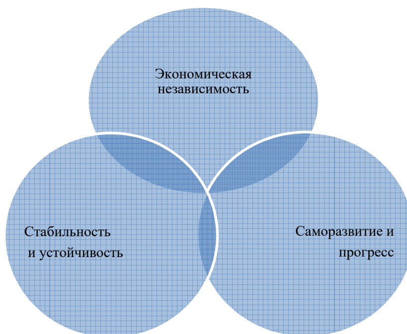
Рисунок 1.- Основные составляющие экономической безопасности региона

Экономическая независимость региона включает в себе возможность осуществлять контроль за региональными ресурсами: повышать уровень производства, контролировать качество продукции, обеспечивать конкурентоспособность региона, принимать участие в межрегиональной и международной торговле.