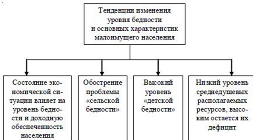
Рис. 1. Характеристики бедности [7]

Характеристика бедности представлена на рисунке 1.