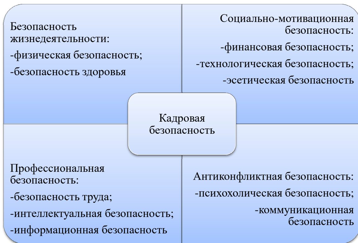
Рисунок 2.- Составляющие кадровой безопасности предприятия

Кадровая безопасность, являясь элементов экономической безопасности предприятия, включает в себя все этапы организации управления, направленные на установление и поддержание трудовых отношений, способствующих обеспечивать надежную деятельность хозяйствующего субъекта.[5] На основе этого, кадровая безопасность имеет ряд характерных составляющих (рисунок 2)