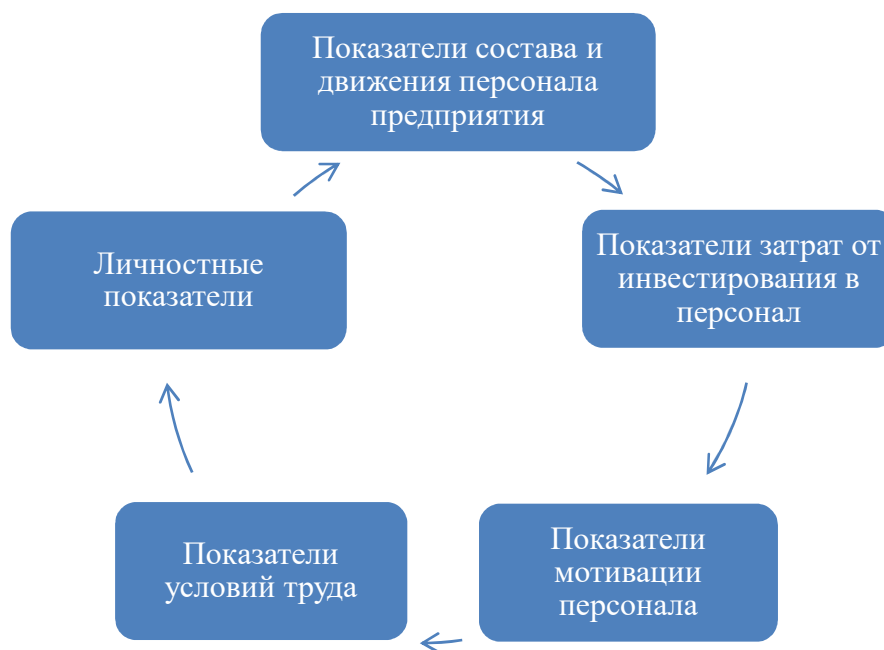
Рисунок 3.- Показатели, формирующие уровень кадровой безопасности предприятия

Показатели состава и движения персонала предприятия- это показатели, характеризующие уровень движения персонала за определённый период времени. Они характеризуются системой абсолютных и относительных показателей.[4] К абсолютным показателям относят: