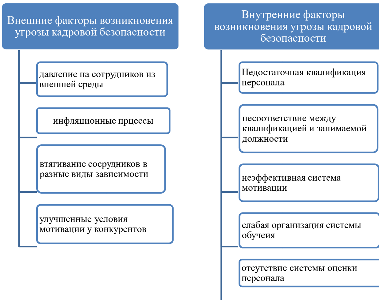
Рисунок 4.- Факторы возникновения угроз кадровой безопасности

Все вышеперечисленные внешние и внутренние угрозы, безусловно, отрицательно влияют на обеспечение кадровой безопасности предприятия. В связи с этим, на специалистов отдела кадров возлагается обязанность по совершенствованию работы с персоналом предприятия с целью обеспечения кадровой безопасности.