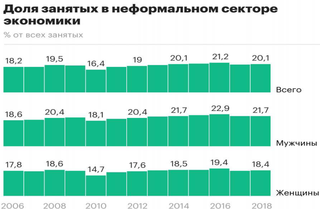
Рис.1 Соотношение населения, занятого в неформальном (теневом) секторе экономики России с общей численностью занятого населения в % [8]

В настоящее время в России характерной чертой экономики является размытость границ между теневой и официальной деятельностью. Во-первых, все большее количество граждан переходят по определенным причинам из официальной экономики в теневой сектор, а во-вторых, в официальном секторе экономики с каждым годом все больше увеличиваются случаи нарушения трудового законодательства, происходит массовое сокрытие доходов. Сегодня вопросы занятости населения в теневом секторе экономики приобретают все большую актуальность.[6]