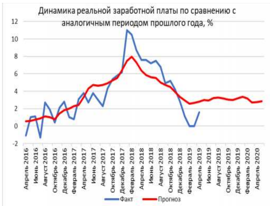
Рис.3 Динамика заработной платы по месяцам с 2016 по 2020 гг.

Сегодня очень важно постоянно отслеживать динамику развития рынка труда и безработицы, проводить обследования населения по проблемам занятости, которые обычно проводятся путем опросов населения. Начиная с 1992года обследование производится на территориях всех субъектов России, где узнается актуальность проблем рынка труда и безработицы, происходит их учет с последующим распространением итогов на всю численность населения страны.[3]