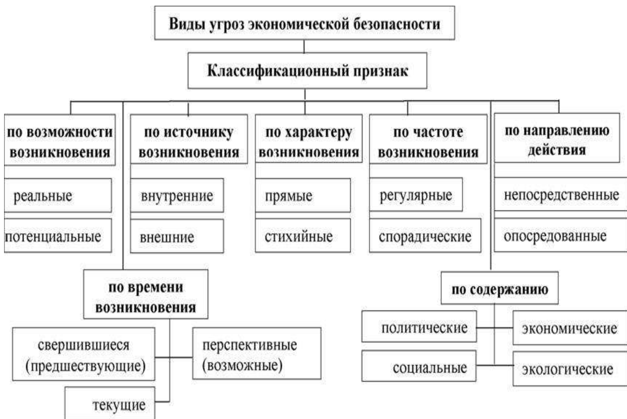
Рис.2Классификация угроз экономической безопасности

На практике выделены следующие виды угроз, оказывающие характерное влияние для каждого субъекта, согласно рисунку 2 [5]: