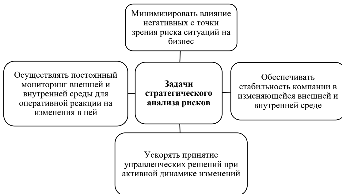
Рисунок 2 – Задачи стратегического анализа рисков

Задачи стратегического анализа рисков, решаемые с использованием аналитического инструментария, представлены данным рисунком 2.