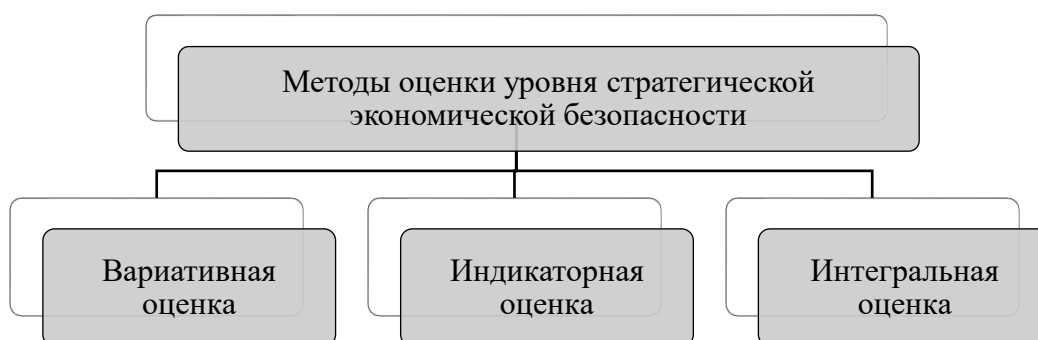
Рисунок 1 - Методы оценки уровня стратегической экономической безопасности хозяйствующих субъектов

Для определения уровня стратегической экономической безопасности предприятия на сегодняшний день используются различные методы. Автором предложено использовать следующие (рисунок 1):