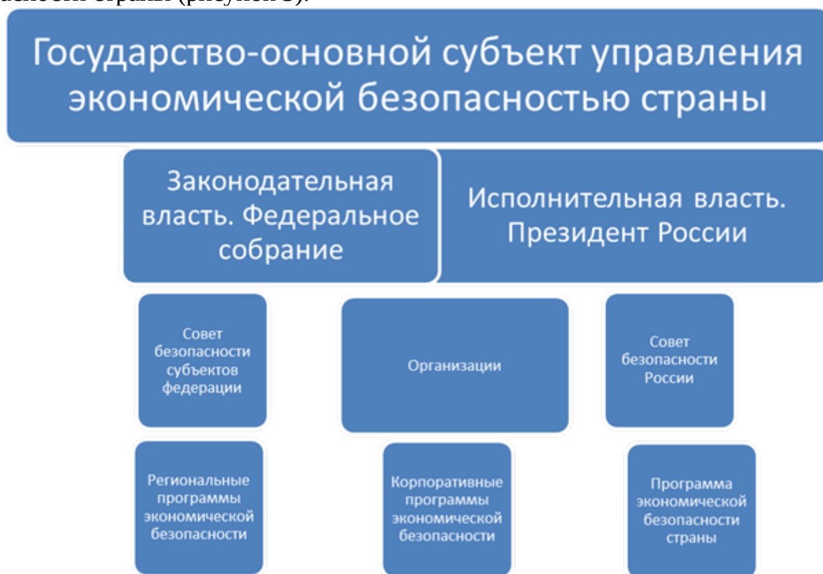
Рисунок 3. Система управления экономической безопасностью [9, с. 90]

Вышеперечисленные механизмы образуют систему управления экономической безопасностью страны (рисунок 3).