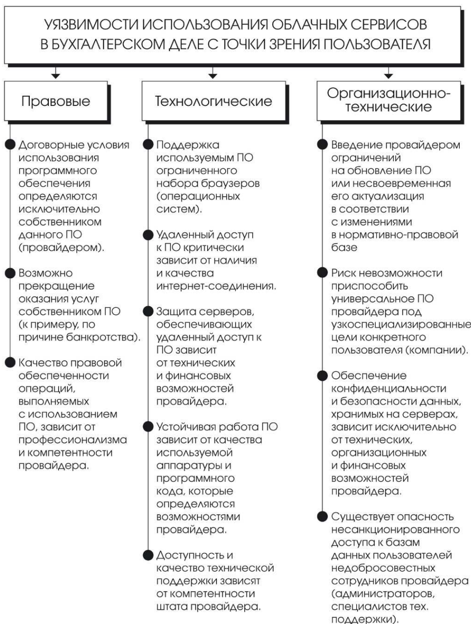
Рисунок 2. Уязвимости облачных сервисов бухгалтерского учета.

Данная схема наглядно иллюстрирует тот факт, что причина потенциальных проблем, которые не стоит сбрасывать со счетов при использовании интернет-бухгалтерии, состоит в соотношении той меры ответственности, которую несет разработчик (поставщик, провайдер) SAAS-продукта и его конечный пользователь.